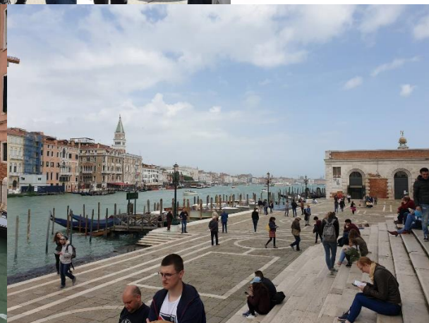
Матуранти четвртог разреда и њихове одељењске старешине у Италији, школске 2018./2019. године